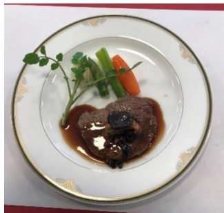
「牛ヒレ肉とフォアグラの ロッシューニ風」

12月10日(土)に、これまで学んだことを生かし、調理科3年間の総まとめとして「感謝の会」が開催されました。今年で22回目を数えます。「感謝の会」では、3年間の成果・頑張りを保護者の皆様に見ていただこうと企画・運営など